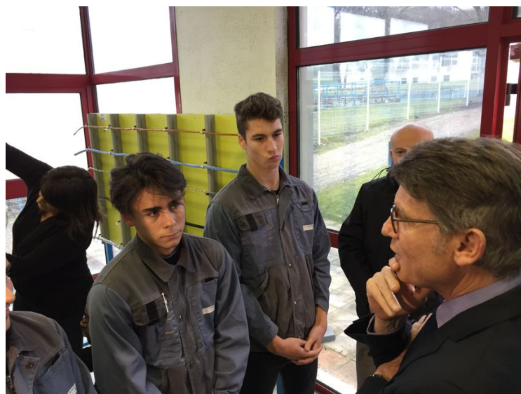
Vincent Peillon en visite sur l'Aérocampus de Latresne

Vincent Peillon était d'ailleurs déjà venu à l'Aérocampus lorsqu'il était Ministre de l'Education nationale pour inaugurer la section franco-allemande du Lycée professionnel, il a d'ailleurs échangé avec certains élèves de la formation.