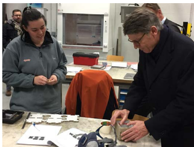
Vincent Peillon avec plusieurs élèves de la section franco-allemande de l'Aérocampus

Beaucoup d'échanges donc, avec humour parfois quand par exemple un élève qui travaille aujourd'hui sur un moteur d'avion détaille sa reconversion et explique qu'avant, il réparait des machines à café : "Normalement ça vole pas... De temps en temps on peut s'énerver et en balancer une..."